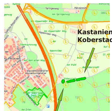
EBkastanie (ehemalige Gruppe von 4 Bäumen)

Bedeutung, insbesondere im Ensemble mit der sich nach Osten anschließenden Edelkastanienallee. Auch das Bild zusammen mit dem aus Rotliegenden und Sandstein gebauten ehemaligen Forsthaus war beeindruckend. Wie wäre es erst gewesen, wenn im 16. Jahrhundert das durch Graf Wolfgang von Ysenburg-Ronneburg projektierte Schloss anstelle in Kelsterbach am Main doch an dieser Stelle in Langen gebaut worden wäre? Die Brunnenanlage für das Schloss ist heute noch unter dem ehemaligen Forsthaus erhalten!