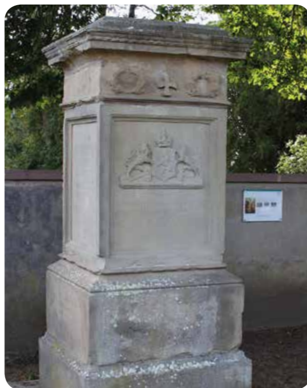
Sockel der Germania, der einst zusammen mit der Figur zur Erinnerung an die Kriegstoten und -verletzten von 1866 und 1870/71 vor der Stadtkirche stand.

Entlang der Wege lassen sich schön gestaltete Grabstätten, historische Grabsteine und ansehnliche Grabfelder entdecken. Nehmen Sie sich Zeit, schauen Sie sich um. Entdecken Sie, wie sich Vergangenheit, Gegenwart und Zukunft hier zusammenfinden.