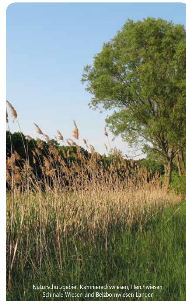
Naturschutzgebiet Kammereckswiesen, Herchwiesen, Schmale Wiesen und Belzbornwiesen Langen