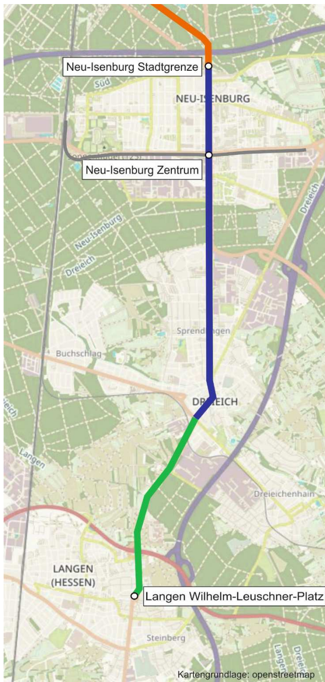
Grafik: Potenzialstudie Straßenbahn Frankfurt – Neu-Isenburg – Dreieich – Langen: Zu untersuchender Streckenverlauf (vereinfacht).