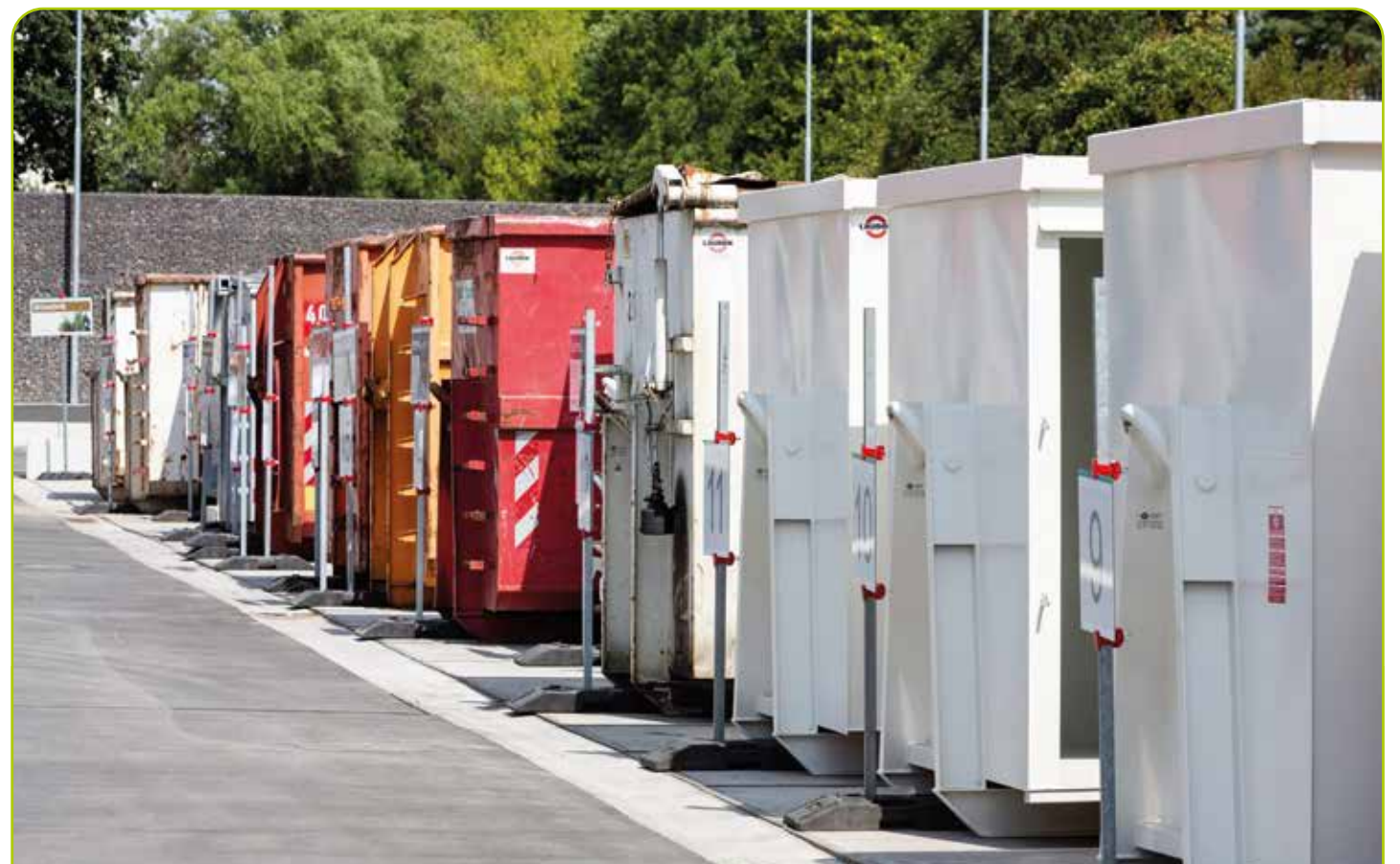
© Magistrat der Stadt Langen, Bauwesen, Stadtplanung, Umwelt- und Klimaschutz | gedruckt auf chlorfrei gebleichtem, umweltfreundlichem Papier aus 100 % Altpapier

Kommunale Betriebe Langen Wertstoffhof, Darmstädter Straße 70 www.kbl-langen.de